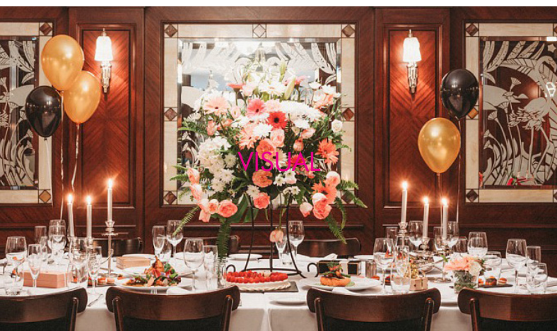
1. Restaurant LA BRASSERIE