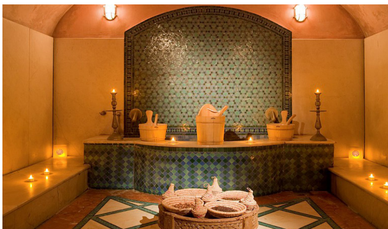
2. Spa Oriental