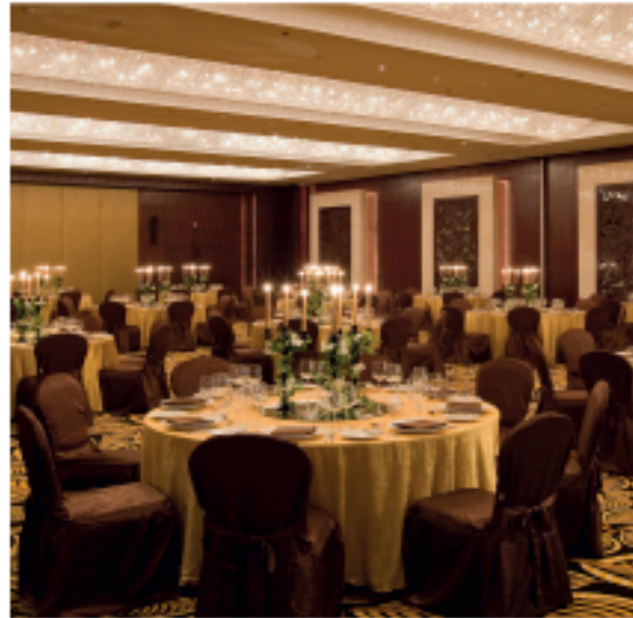
Weddings at Monte Carlo Ballroom

ردهة حوض المباحة المفتوح ردهة حوض السباحة المطل على البحر، تقدم دبي للفنل مناظر عروب الشمس على الطبخ العربي. وبد هذا المكان مثلاً لتنظيم حفلات الزفاف الحفلة أو أي تظلية أخرى.