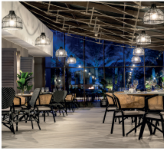
Dinner at Plantation Brasserie